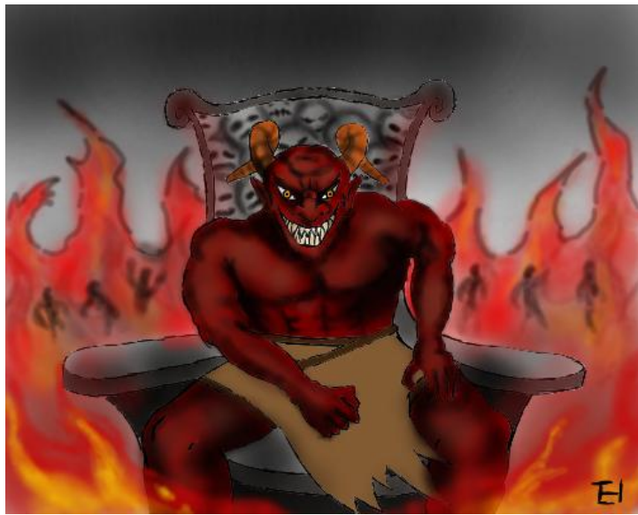
အပြစ်ဆိုတာ ပေးဆပ်ရစမြဲပါ။

ယောဟန် ၃:၃၆.၁ `သားတော်ကိုပယ်သောသူမူကား အသက်ကိုမတွေ့ရ။ ထိုသူ၏အပေါ်၌ ဘုရားသခင်၏ အမျက်တော် တည်နေသည်။´