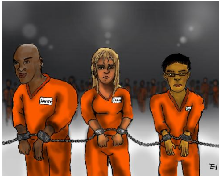
တို့အားလုံးဟာ အပြစ်ရှိသူတွေပါ။

ယောဟန် ၃:၁၉ 'အပြစ်စီရင်ခြင်းကိုခံရကြောင်းကား အလင်းသည် ဤလောကသို့ဝင်၍ လူတို့သည် မကောင်းသောအကျင့်ကို ကျင့်သောကြောင့် အလင်းထက်မှောင်မိုက်ကို သာ၍နှစ်သက်ကြ၏။'